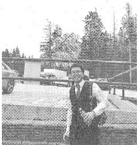
カナダの大自然の中での記念撮影

の方が多いらしく、スタッフ募集や日本語で買い物できま、などのお店がたくさんありました。現地の方が、日本人は山が好きなのだとおっしゃっていましたが確かにそうかもしれません。(以前にも紹介させていただいたジャスパールという町にも日本人がたくさんいますがその町も山に囲まれています)。