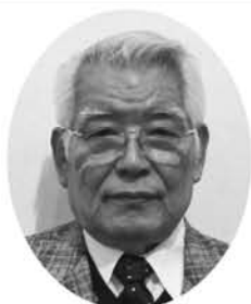
だ い げ ん と み お