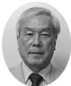
な か だ と し ゆ き