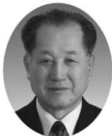
お ち あ い せ い そ う