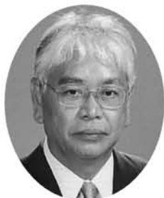
あ ぎょ こ う い ち